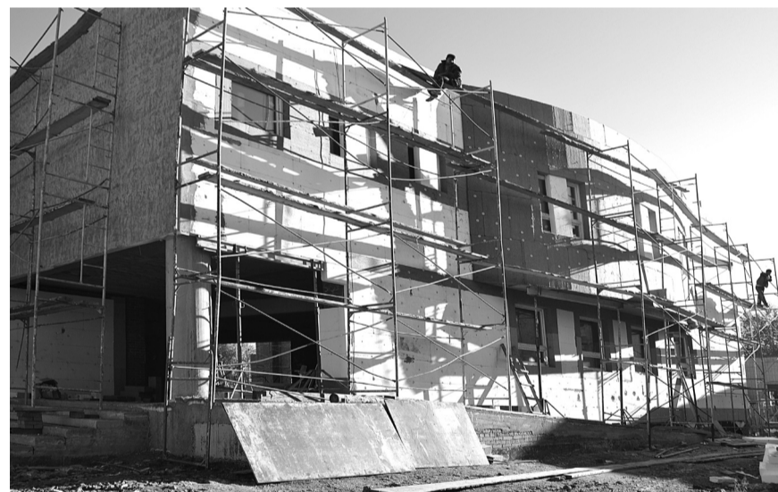
По проекту в бассейне будут располагаться три ванны, в том числе для самых маленьких. Размеры основного бассейна – 25х14 метров, шесть дорожек. Здесь можно будет проводить не только занятия по оздоровлению, но и различные соревнования местного и областного уровня.

Сегодня администрация нашего городского округа делает все от нее зависящее для завершения необходимых строительных работ в текущем году и возобновления их в следующем, чтобы долгожданное открытие бассейна состоялось. Ведь этот вопрос важен как для руководства территории, так и для всех жителей нашего городского округа.